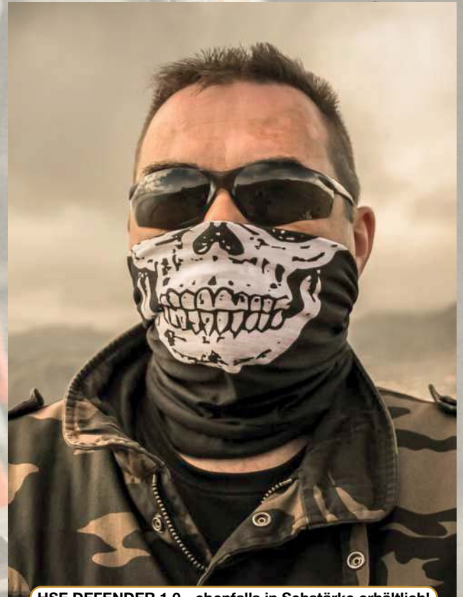
HSE DEFENDER 1.0 - ebenfalls in Sehstärke erhältlich!

Dafür beeindruckt mich der Werdegang von Helbrecht Optics (so der offizielle Name der